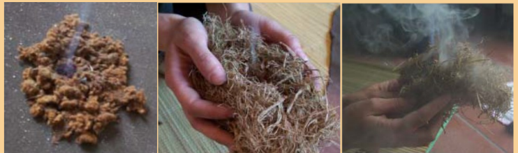
L'accensione del fungo

Nei metodi a percussione, le scintille venivano fatte cadere prima sul fungo dove si mantenevano, poi la brace era posta sopra l'erba secca dove veniva fatta espandere soffiandoci sopra fino a vedere scaturire le fiamme.